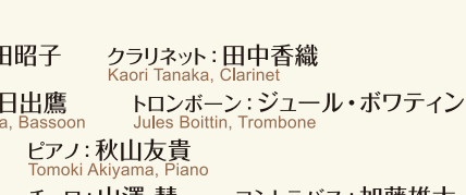
安達真理 山澤 慧 加藤雄太

8.26 (木) 19:00開演 [18:20開場] ブルーローズ (小ホール) Thursday, August 26 at 19:00 (Doors open 18:20) / Blue Rose (Small Hall)