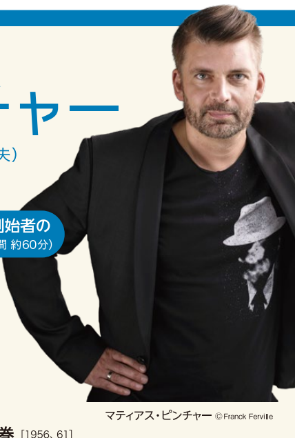
マティアス・ピンチャー

◆ 指定席 S席4,000円/A席3,000円/B席2,000円/学生1,000円 Reserved Seating S¥4,000 / A¥3,000 / B¥2,000 / Student ¥1,000