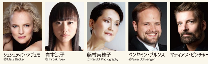
シェシュティン・アヴェモ 青木涼子 藤村実穂子 ベンヤミン・ブルンス マティアス・ピンチャー

◆ 指定席 S席5,000円/A席4,000円/B席3,000円/学生2,000円 Reserved Seating S¥5,000 / A¥4,000 / B¥3,000 / Student ¥2,000