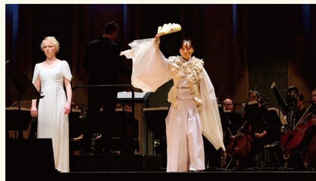
細川俊夫：オペラ「二人静」(2017年世界初演時)

The Producer Series ENSEMBLE INTERCONTEMPORAIN From Paris into the World's Pioneers of "New Music"