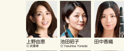
上野由恵 © 武蔵野 池田昭子 © Yusaku Yoneda 田中香織