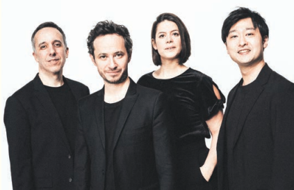
エベヌ弦楽四重奏団