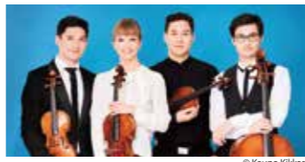
シューマン・クアルテット

世界を舞台に鮮烈なインパクトをもたらしている若き俊英たちの「今」を紹介するシリーズ。情熱的な音楽づくりと一体感には特に定評が高い韓国の「ノブース・クアルテット」、数多ある現代のカルテットの中でも最高峰の一角と評判の「シューマン・クアルテット」、ミュンヘン国際音楽コンクール優勝以来、日本の室内楽界に明るい話題を振りまいている「葵トリオ」。未永く応援していきたい3団体が、生き活きとしたアンサンブルで魅了します。