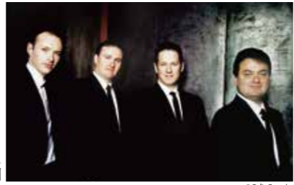
エルサレム弦楽四重奏団

第3番 ニ長調 作品18-3 No. 3 in D Major, Op. 18, No. 3 第9番 ハ長調 作品59-3「ラズモフスキー第3番」 No. 9 in C Major, Op. 59, No. 3, "Razumovsky No. 3" 第14番 嬰ハ短調 作品131 No. 14 in C-sharp Minor, Op. 131