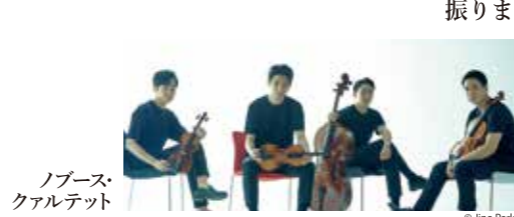
ノブース・クアルテット