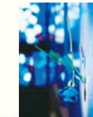
サントリーホール チェンバーミュージック・ガーデン これまでの公演、リハーサルより