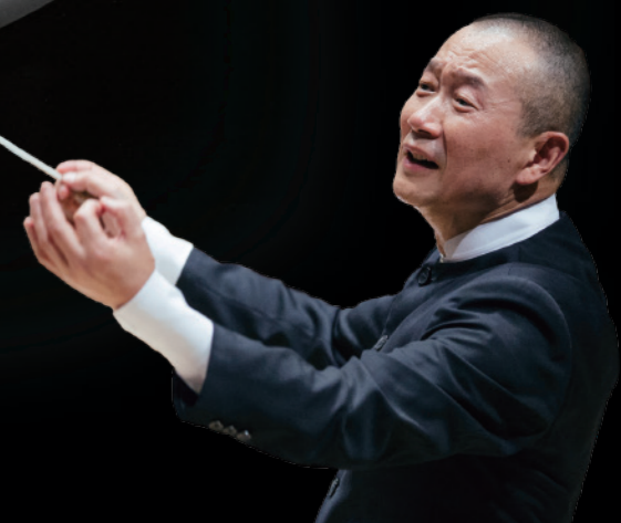
写真：『TEA ～茶は魂の鏡～』2023年上海公演および25年福建省・福州公演

聖禱 (日本の高僧) — 発見/哲学 唐の皇子 — 怒 蘭 (唐の皇女) — 愛 唐の皇帝 — 伝統/文化 陸 (陸羽の娘) — 茶/精神の伝達者 3人の打楽器奏者 — 自然 僧侶たち — 宗教 管弦楽 — ドラマ