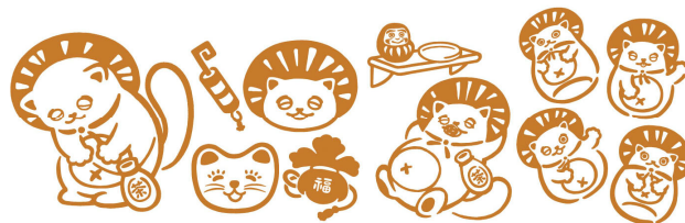
〈ラベル裏面デザインのイメージ〉

京都老舗茶舗が丁寧に作りこんだ質の良さと洗練されたイメージはそのままに、クリアで明るい水色（すいしょく）をより体感いただけるよう、サントリー緑茶「伊右衛門」600mlと同様のボトルを採用しました。「京都BLEND」のロゴも進化させ、さらに洗練されたモダンなパッケージに仕上げています。また、ラベル裏面デザインには「日本のことわざ」をテーマにした新たなイラスト（全5種）を採用しています。