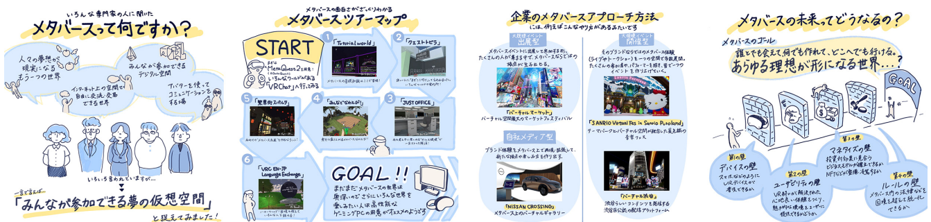
「メタバース解説レポート」イメージ

https://twitter.com/suntory/status/1571061397827604480?s=20&t=vj6IHCZa55lqGBaPLRJliA