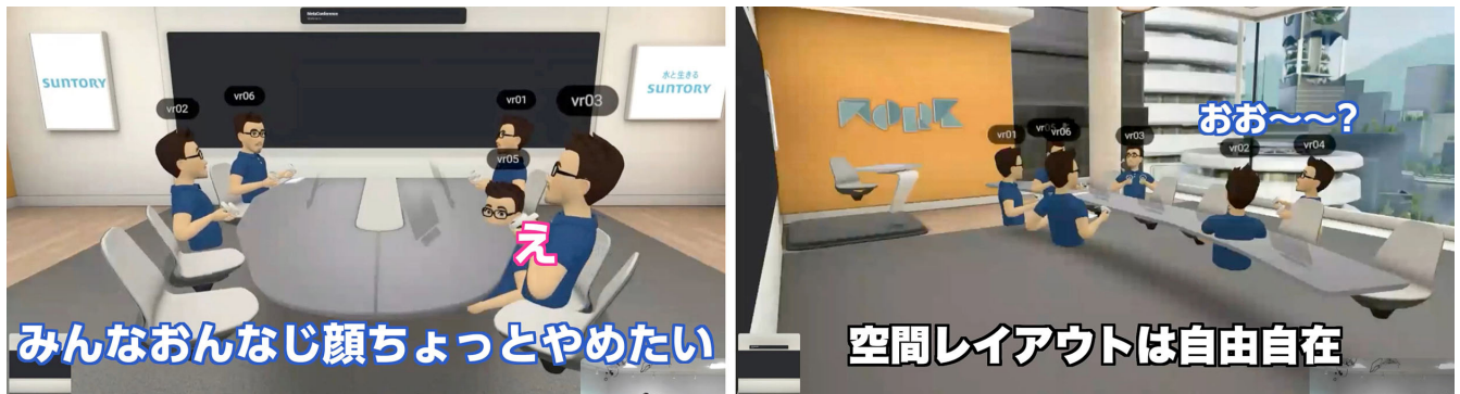
「サントリー社員によるメタバース体験動画」より

https://twitter.com/suntory/status/1570336671991734274?s=20&t=vj6IHCZa55lqGBaPLRJliA