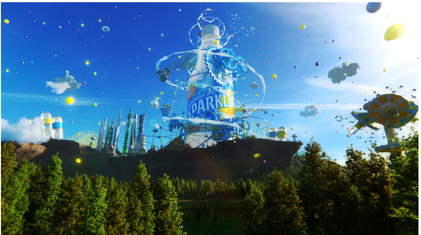
「サントリー天然水スパークリングレモンの遊園地」予告動画より

※本プロジェクトはメタバースについて学び考えるプロジェクトであり、実際にメタバース空間を作るものではありません。