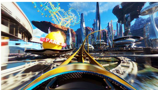
「サントリー天然水スパークリングレモンの遊園地」予告動画より

「サントリー天然水スパークリングレモンの遊園地」のイメージ動画の全貌は近日公開予定です。