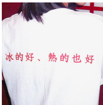
「冰的好、熱的也好」 訳「ホットでも、アイスでも」