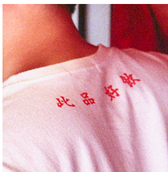
「此品、好飲」 訳「すごくおいしいよ」

「サントリー烏龍茶」のロゴを中心に据えつつ、アクセントとしてアパレルアイテムの定番の一つである中国語デザインをプラス。さりげなく配置した、烏龍茶の気分ぴったりのワードにご注目ください。