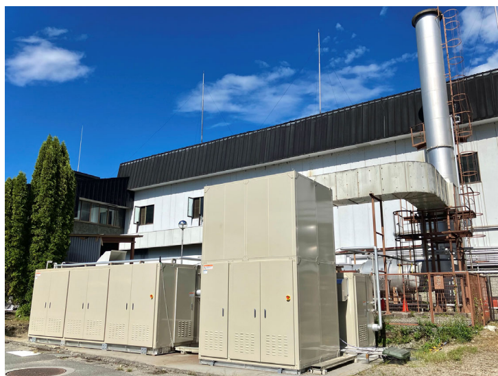
CO 2 分離・回収装置

この高解像度画像は https://www.suntory.co.jp/news/index.html に掲載しています。