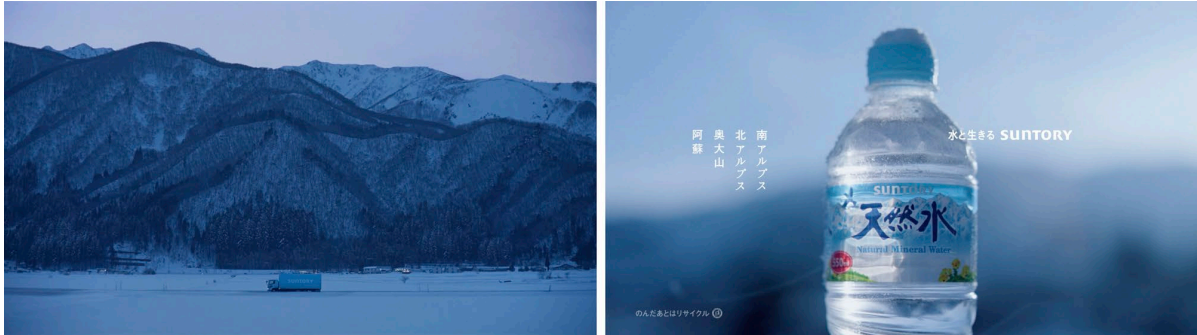
新TV-CM「水の山から／水源」篇