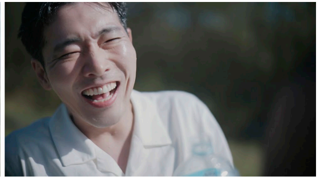
新TV-CM「水の山から／ いのち 生命」篇

サントリービバレッジ&フード(株)は、「サントリー天然水」の新TV-CMとして、柄本佑さんが出演し、安藤サクラさんがナレーションを務める「水の山から／ いのち 生命」篇、「水の山から／水源」篇(各30秒、60秒)を、5月28日(木)から順次、全国でオンエア開始します。