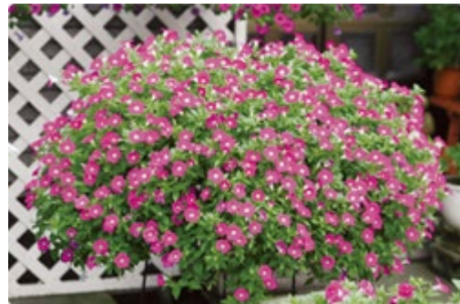
【植え込み後約3ヶ月】

●だんだん日照時間が短くなってきますので、晩秋まで花を咲かせるためには8月上～中旬に形を整える程度の摘芯を行ってください。たくさんのお花を長く楽しめます。