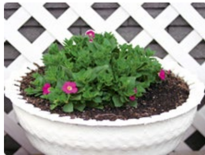
【植え込み後 約1ヶ月】