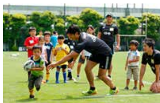
ラグビークリニックの様子

サントリーグループは、スポーツを通じた子どもたちの健全な心と体の育成を支援するため、さまざまな活動を行っています。その一環として、サントリーのスポーツチームも競技の普及活動に取り組み、ラグビー部「サンゴリアス」・バレーボール部「サンバーズ」の選手が子どもたちを直接指導するクリニックを各地で開催しています。その他、サンゴリアスは「サントリーカップ全国小学生ラグビー選手権大会」の運営サポートなど、子どもたちがラグビーに触れるさまざまな機会を協力をしています。またサンバーズは小学校の授業で「体を動かす楽しさを知ってもらうためのボール遊び教室」の開催や、地域のバレーボール大会の運営サポートなどを実施しています。2018年は、これらの活動に20,000人を超える子供たちが参加しました。