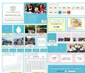
サントリーボランティアーズのイメージ

国際貢献ボランティア「みんなで布チョッキン」「絵本を届ける運動」のプログラムをNPOと協働でパッケージとして整え、「サントリーボランティアーズ」上に掲載、社員自らが希望の場所で開催できる形を実現しました。また支援制度として、「ボランティア休暇制度」を設けています。