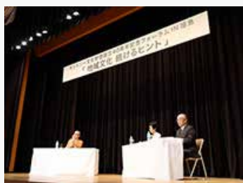
「地域文化を思う」をテーマにした ディスカッションの様子

東京・福島・富山・広島・大阪（※公開中止）の5都市で開催し、地域文化の存続、発展に寄与する提言（『続けるヒント』）を報告するとともに、地域文化の実践者・支援者と知恵を共有するフォーラムを開催しました。