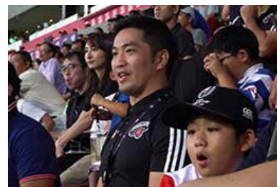
サンゴリアス選手との 2019年ラグビー W杯観戦企画 『サントリーサンゴリアスと行く！ ラグビー W杯観戦ツアー』