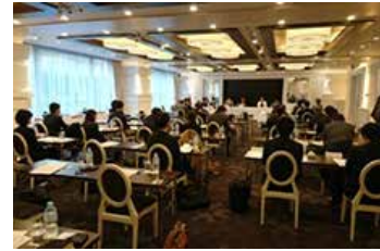
「若手研究者のための チャレンジ研究助成」報告会