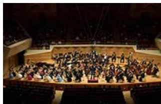
子ども奏者による演奏

子どもたちが定期的にコンサートホールに行く習慣を身につけ、生活の中にクラシック音楽を取り入れてほしいという願いをこめて、2002年から「こども定期演奏会」を開催しています。これは、日本初の子どものためのオーケストラ定期演奏会です。聴くだけでなく参加できることが特徴で、チラシの絵やシーズンのテーマ曲も子どもたちから募集・採用しています。また、オーディションにより選ばれた子ども奏者がオーケストラの一員として演奏できるプログラムをはじめ、楽団員のレクチャーのもとで楽器に直接触れる企画や子どもレセプション体験など、参加型企画の充実を図っています。