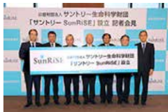
「サントリー SunRiSE 生命科学研究者支援プログラム」記者会見

2020年1月31日、「サントリー SunRiSE 生命科学研究者支援プログラム」を設立しました。基礎研究における若手研究者の“知りたい、極めたい”を実現できるよう、資金の使途や期間の制限をできる限り排除した柔軟性・有効性の高い支援を行います。研究者間のコミュニケーションのみならず、財団の人脈、さらにサントリーの人脈を活用した、「知のネットワーク」を構築し、社会に発信していきたいと考えています。(SunRiSE: Suntory Rising Stars Encouragement Program in Life Sciences)