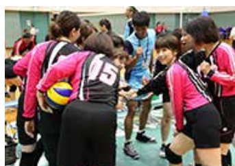
地域を対象にしたバレーボールクリニック