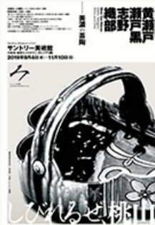
「黄瀬戸・瀬戸黒・志野・織部 一美濃の茶陶」展 ポスター

すべての展覧会で日本語と英語による音声ガイドの貸し出しを行い、館内の茶室「玄鳥庵」にて指定日に呈茶席を設けるなど、国内外のお客様に日本文化に親しんでいただける取り組みを続けています。