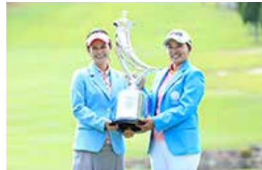
鈴木愛プロと大会アンバサダー宮里藍さん (2019年大会優勝時)