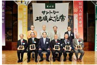
「サントリー地域文化賞」贈呈式