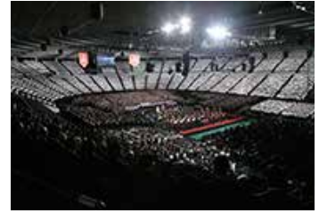
サントリー 1万人の第九

また2017年からは、TV放送に加え、より多くの方にご覧頂くためにLIVE配信<LINE LIVE>を展開しています。