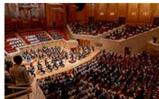
サントリーホールでの 港区&サントリーホール Enjoy! Music プロジェクト