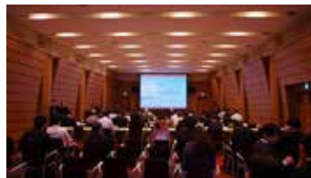
2017年度研究所報告会 (大阪大学中之島センター佐治敬三メモリアルホール)

ゴマの健康成分「セサミン」とともにゴマ種子に含まれる抗酸化物質「セサモリン」および「セサミノール」の生合成酵素遺伝子を世界で初めて発見、葉の縁の凸凹の形を制御する遺伝子の解明、花の色素とフラボノイド配糖体との相互作用による青色形成メカニズムの解明など、多くの研究成果が著名な学術論文に掲載されています。また、年度ごとに共同研究者や第一線の研究者を招いて報告会を開催しています。