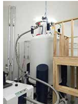
800MHz超伝導核磁気共鳴分析装置

ゴマの健康成分「セサミン」とともにゴマ種子に含まれる抗酸化物質「セサモリン」および「セサミノール」の生合成酵素遺伝子を世界で初めて発見、葉の縁の凸凹の形を制御する遺伝子の解明、花の色素とフラボノイド配糖体との相互作用による青色形成メカニズムの解明など、多くの研究成果が著名な学術論文に掲載されています。また、年度ごとに共同研究者や第一線の研究者を招いて報告会を開催しています。