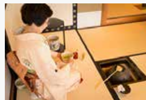
呈茶席(展覧会開催中の指定日のみ)