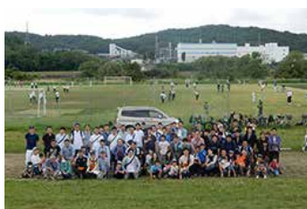
武蔵野ビール工場の社員・家族による多摩川の清掃ボランティア

全国にあるサントリーグループの各事業所では、周辺の清掃をはじめ、自治体が主催するごみ拾いへの参加など、環境美化に取り組んでいます。