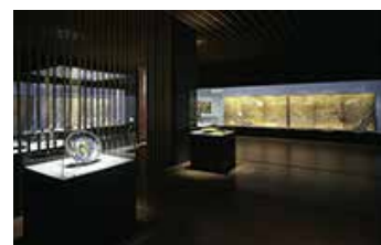
サントリー美術館

サントリー美術館は「生活の中の美」を基本理念に1961年に開館、日本美術やガラスを中心とした企画展と作品の収集活動を展開しています。2007年3月には六本木の東京ミッドタウンに移転。ミュージアムメッセージ「美を結ぶ。美をひらく。」のもと、国宝1件、重要文化財15件をはじめとする約3,000件の収蔵品を核に多彩な企画展を開催し、日本人の“美への感性”を後世に継承していく活動を続けています。「都市の居間」をテーマに建築家・隈研吾氏によって設計された美術館には、ショップやカフェ、さまざまなプログラムを開催するホール、茶室などもととのっています。