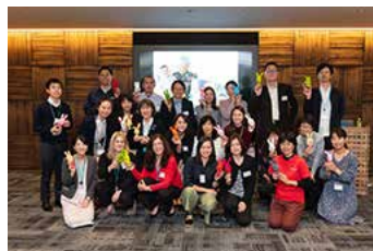
Global Volunteer Meetingの様子