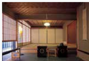
茶室「玄鳥庵」(美術館6階)

すべての展覧会で日本語と英語による音声ガイドの貸し出しを行い、館内の茶室「玄鳥庵」にて指定日に呈茶席を設けるなど、国内外のお客様に日本文化に親しんでいただける取り組みを続けています。