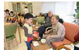
高殿苑とつばみ保育園での交流