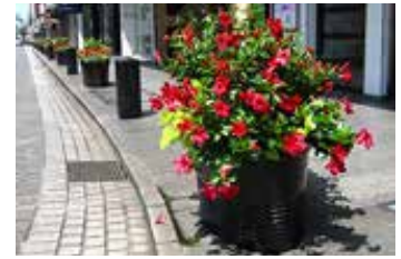
「赤い花プロジェクト」の植栽

「地域に花のある暮らし」を多くの方に体験していただくため、公園などに花苗を提供しています。2012年からは「赤い花で日本を元気に！」をスローガンに、全国各地の公園や公共施設などに花を植え、コミュニティの活性化にも役立てていただく活動「赤い花プロジェクト」を全国で展開。「サフィニア・レッド」の花苗を全国各地の団体へ寄贈しました。2015年からは活動の輪をさらに広げて「大きな花プロジェクト」として取り組んでいます。さらに2019年からは「あしたの花にできることプロジェクト」として、東北や熊本の復興支援などを中心に、花の力で一人でも多くの人達が笑顔になるよう、活動を継続していきます。