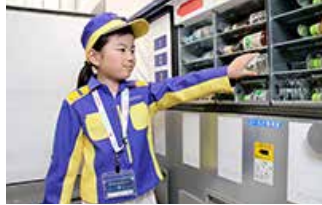
自動販売機の中を知る

サントリーグループでは、子どもたちが楽しみながら社会のしくみを学ぶことができる、職業・社会体験型施設「キッズニア東京・甲子園」に、自動販売機の運営体験ができるパピリオン「ピバレッジサービスセンター」を出展しています。「ピバレッジサービスセンター」では、自動販売機の仕組みを知り、商品をお客様へお届けする上での知恵や工夫を学び、美味しさと安心・安全を支える人々の想いを感じることができます。普段何気なく目にして街の風景である自動販売機に実際に触れ、運営体験を通して、「職業観」を育成し、子どもたちの毎日の新たな気づきに繋がることを願っています。