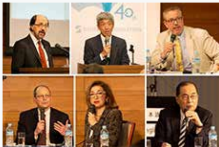
国際シンポジウム 「高齢化社会はチャンスになりうるか」

世界に先駆け超高齢化社会を迎えた日本の課題について、グローバルに活躍するオピニオンリーダーを招聘し国際的視野から検証するシンポジウムを開催しました。