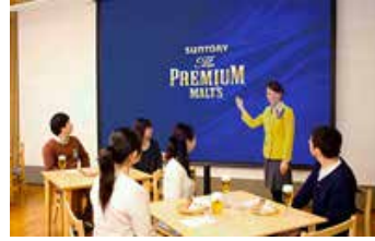
ビール工場での特別セミナー開催