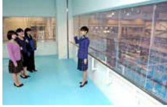
天然水工場での工場見学

美味しさや安全へのこだわり、自然環境への配慮など、商品を通じた取り組みを多くの方に知っていただくため、ビール工場・ウイスキー蒸溜所・ワイナリー・天然水工場などで、工場見学を実施しています。製造工程を見学しながら、ものづくりのこだわりについてわかりやすくご説明するほか、試飲などをお楽しみいただけます。また、ビールづくりのこだわりや、ウイスキーの楽しみ方などを学べる特別セミナーも開催しており、年間約66万人のお客様にご来場いただいています。