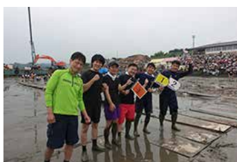
「ガタリンピック」競技ボランティア

サントリー地域文化賞2017年受賞「鹿島ガタリンピック」では競技審判のサポート、2018年受賞「因島水軍まつり」では太鼓運びなどの運営サポートなど、地元の方々と共にイベントを盛り上げました。