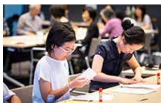
「はじめてひらく 美のとびら」シリーズ

サントリー美術館は、ミュージアムメッセージ「美を結ぶ。美をひらく。」のもと、次世代への教育普及活動に積極的に取り組んでいます。中学生以下は入館無料のうえ、鑑賞支援ツール「わくわくわーくしーと」を無料で配布し、見どころをガイドするだけでなく、自由な発想で鑑賞を楽しむ心を育てます。お客様と美術館をつなぐ交流の場としてスタートした「エデュケーション・プログラム」では、展覧会に関連する記念講演会や特別公演など、さまざまなプログラムを開催。2019年は、美術初心者を対象にした体験型ミニレクチャー「はじめてひらく 美のとびら」のほか、毎週土曜日にはスライドを使ったわかりやすい展示解説「フレンドリートーク」などを実施しました。さらには、「スクール・プログラム」として、港区を中心とした小・中学校の児童・生徒の来館受け入れや出張授業にも積極的に取り組んでいます。