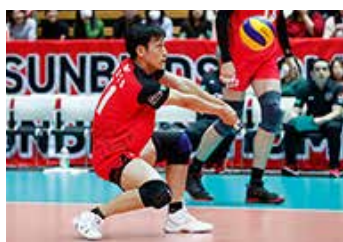
バレーボール部「サントリーサンバーズ」

なおサンバーズは社会貢献活動も積極的に行っており、高齢者向けのボールを使った運動指導、警察と連携した青少年非行防止の啓発や防犯運動のサポートなど、多様な活動に協力しているほか、東日本大震災復興支援活動として岩手県や宮城県、熊本地震復興支援活動として熊本県の小中学生を対象にバレーボールクリニックを開催しました。