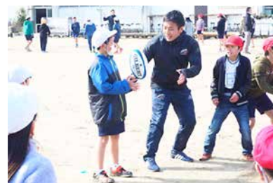
サントリーサンゴリアスによる ラグビー教室