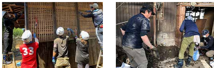
2018年、2019年、各地の災害ボランティア

2018年西日本豪雨、2019年台風19号発生後、会社として実施した義捐金抛出や商品供給だけでなく、社員一人ひとりが被害を受けた方々の助けとなることを目的として、ボランティアを派遣しました。2年間で200名を超える社員が、岡山県、栃木県、長野県などで、被害にあわれた住宅の床下の泥かき、家具の撤去、リンゴ畑の清掃活動などを行いました。