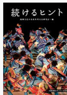
提言書『続けるヒント』