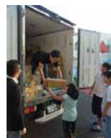
都内児童養護施設への寄贈

2010年より首都圏で開始し、さらに2013年からは沖縄へも範囲を広げています。今後も、このフードバンク活動を継続し、必要に応じた数量を適宜お届けしていきます。