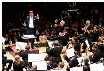
ウィーン・フィルハーモニー ウィーク イン ジャパン2019 クリスティアン・ティールマン指揮 ウィーン・フィルハーモニー管弦楽団