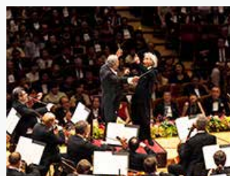
30周年記念 ガラ・コンサートカーテンコール