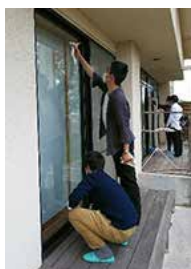
窓拭きボランティア

社会福祉法人「邦寿会」が運営する高齢者福祉施設や保育園では、毎年サントリーグループの社員が園芸、窓拭き、運動会の運営サポート等の作業を施設職員とともに実施しています。また、グループの新入社員も各施設で邦寿会の歴史・創業者の社会貢献への想いを研修した上で、道路の清掃や草抜きなどのボランティア活動に参加しています。