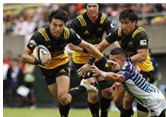
ラグビー部「サントリーサンゴリアス」

なお、サンゴリアスは、社会貢献活動にも力を入れており、ラグビークリニックの開催の他、地域の清掃活動、復興支援活動などにも積極的に参加しています。2019年には日本で開催されたラグビーワールドカップを被災地の方々と一緒に観戦するイベントを行うなど、子どもたちや女性など、多くの人にラグビーを知ってもらおう新たな取り組みも積極的に行っています。