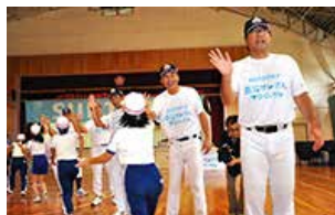
チャリティ金を活用した被災地でのキャッチボール教室