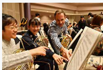
ウィーン・フィル&サントリー音楽復興基金 仙台ジュニアオーケストラとの音楽交流

ウィーン・フィルハーモニー管弦楽団と協働で音楽活動の助成「音楽復興祈念賞」や被災地での「こどもたちのためのコンサート」、ジュニアオーケストラの指導、献奏など、多くの活動を展開しています。