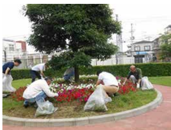
お花植え・草抜きボランティア