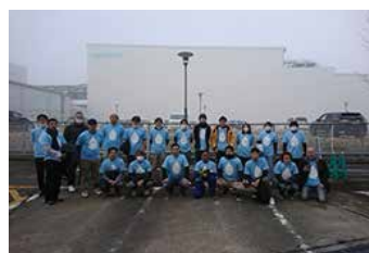
宇治川工場の社員による工場周辺の清掃ボランティア