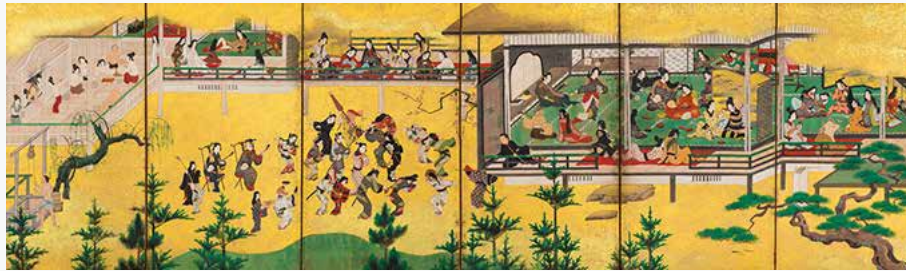
邸内遊楽図屏風 六曲一隻 江戸時代 17世紀 サントリー美術館

2019年は幕末・明治期に独自の道を切り開いた絵師・河鍋暁斎を特集した「河鍋暁斎 その手に描けぬものなし」展、佐藤オオキ氏率いるデザインオフィスnendoとのコラボレーションによる「information or inspiration? 左脳と右脳でたのしむ日本の美」展、美術のテーマとなった「遊び」に着目した「遊びの流儀 遊楽図の系譜」展、個性的で生き生きとした美濃焼の造形の魅力を紹介した「黄瀬戸・瀬戸黒・志野・織部 一美濃の茶陶」展など、サントリー美術館ならではの4つの企画展を開催し、いずれも人気を博しました。