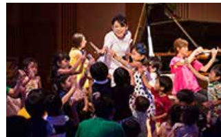
サントリーホールとサントリー美術館の共同企画 「サントリーアートキッズクラブ いろいろドレドレ」