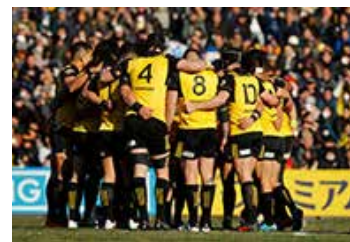
日本選手権優勝8回を誇る