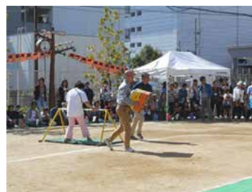
つばみ保育園運動会のボランティア