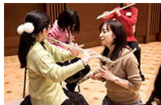
楽器に触れる体験コーナー