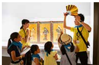
作品を前にした対話型鑑賞