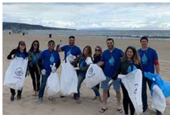
ビームサントリー社のビーチクリーン

また、世界各地でボランティア活動推進を担当しているメンバーが一堂に会する「Global Volunteer Meeting」を実施し、今後のボランティア活動について検討を行いました。