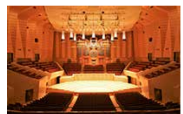
サントリーホール

サントリーホールは、1986年に東京初のコンサート専用ホールとして開館しました。偉大な指揮者である故カラヤン氏に「音の宝石箱」と評されたヴィンヤード形式の大ホールと、ブルーローズ(小ホール)の2つのホールで、国内外の一流アーティストによる演奏が繰り広げられています。毎年、年間約550を超える公演に、約60万人のお客様が来場されています。