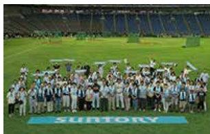
東北から100名を招待

1995年から開催しているイベント「サントリードリームマッチ」では、ビールや飲料、グッズ、チャリティシートなどの売上金や出場選手サイン入りユニフォームのチャリティオークション収益の一部を活用し、プロ野球の現役選手やOBによる野球教室・キャッチボール教室の実施など東北の野球復興に役立てられました。その他、東北在住の方を抽選で100名を無料で招待したり、売上の一部がチャリティとなる有料席「東北応援チャリティシート」の実施など東日本大震災の復興を応援しています。