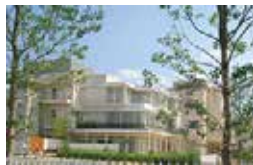
総合福祉施設 どうみょうじ高殿苑