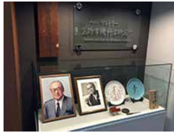
財団の歴史を紹介する展示

自らの研究所を「構造生物学」「有機化学」「分子生物学」の異分野融合拠点として位置付け、大学などの研究機関との共同研究を推進しながら「代謝」「生体膜」「シグナリング」をキーワードに「分子を中心に据えた生命現象のメカニズムの解明」を目指した研究活動に取り組んでいます。また、大学などの研究を支援する解析センター事業、若手研究者への研究助成、大学院生への奨学金、学術集会助成などの研究奨励助成事業、ならびに大学院連携講座の開設による研究・教育支援、博士客員研究員制度などの研究人材育成事業を行っています。