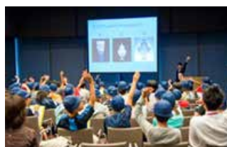
学校団体のための「スクール・プログラム」