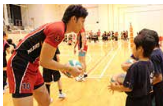
バレーボールクリニックの様子