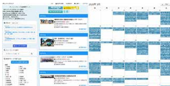
ボランティアウェブのイメージ