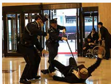
防犯の実地訓練を通じた、安全・安心への取り組み