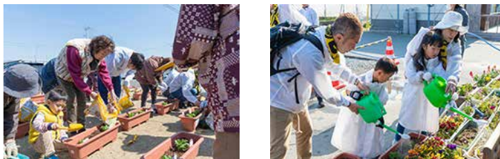
熊本の仮設住宅でのお花植えボランティア

熊本復興支援「サントリー水の国くまもと応援プロジェクト」活動の一環として、サントリーフラワーズと協働実施。熊本地震で特に被害の大きかったサントリー九州熊本工場にほど近い、3町益城町・嘉島町・御船町の仮設住宅へ花苗をお届けし、仮設住宅にお住まいの方と一緒に「サフィニア」を植えました。