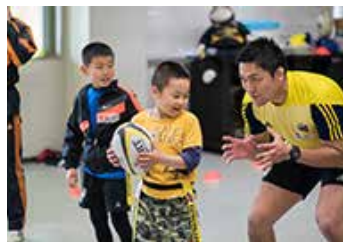
ラグビークリニック参加者