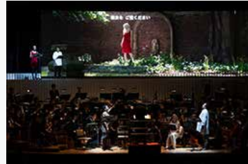
サントリーホール サマーフェスティバル2019