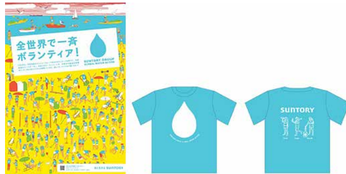
「Suntory Group Global Water Action」ポスター・Tシャツ

3-4月のボランティア月間テーマは「水」。世界各地で、サントリーグループの社員がビーチクリーンなど「水」に関するボランティア活動を一齐に展開しました。海外グループ会社も同タイミングで活動を強化しました。