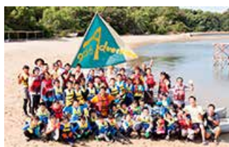
余島サマーキャンプ

サントリーグループは香川県小豆郡にある無人島の余島（よしま）で1950年からキャンプ場を運営している公益財団法人 神戸YMCAと、2007年から協働で「余島プロジェクト」を推進しています。これは無人島ならではの豊かな自然環境の体験・体感を通じて子どもたちの夢や挑戦する気持ちを育むプロジェクトで、夏に開催される「余島サマーキャンプ」等、年間を通じてさまざまなプログラムを企画・展開しています。2019年は約3,500名の子どもたちが余島を訪れました。