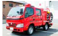
宮城県名取市に寄贈した消防車両

2011年からは東日本大震災で甚大な被害を受けた被災地への支援として、宮城県名取市・仙台市に消防用車両などを寄贈いたしました。2016年からは熊本地震被災地および東日本大震災への復興支援等を実施しています。