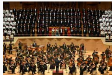
避難訓練付きコンサートの様子