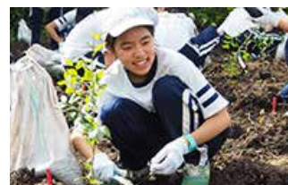
林間学舎での植樹のようす

鳥井信治郎が1950年に学校法人 雲雀丘学園の初代理事長に就任して以降、同学園の幼稚園から高等学校までの一貫教育を支援しています。鳥井信治郎は「親孝行」の気持ちを大切にしており、「親孝行な人はどんなことでも立派にできます」が口癖でした。その創立精神は受け継がれ、学園では現在も、「親は子の成長を願い、子は親に感謝し尊敬するという、人としての自然なところが基本となって、家庭の輪につながり、社会のために尽くす気持ちが湧き出る」と考え、人間教育に取り組んでいます。2008年からは「環境講座」の開講を支援し、現在は次世代教育の一環として、小中学校への「花育（はないく）」や「水育」、校外学習を通じた環境教育支援、サントリーグループの研究分野の知見を生かした科学教育など、本学の活動を支援しています。