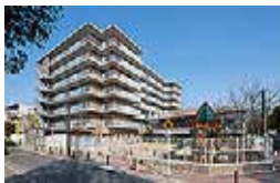
特別養護老人ホーム 高殿苑とつばみ保育園

2021年、大阪市内で最初の社会福祉活動を行った法人「邦寿会」は創立100周年を迎えます。