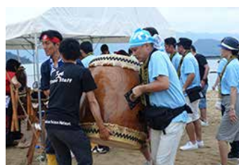
「因島水軍まつり」運営ボランティア