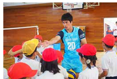
サントリーサンバーズによる バレー教室