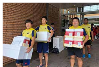
サントリーサンゴリアス選手も参加

※フードバンク活動：製造・流通過程などで出る、安全上は問題がないにも関わらず、廃棄される食品の寄付を受け、社会福祉施設などに無償で提供する活動