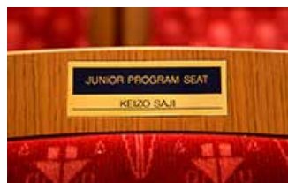
佐治敬三ジュニアプログラムシート

小・中学生を対象に各回ペア3組を大ホールでの土日祝日の対象公演にご招待しています。