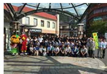
青少年非行防止の啓発