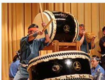
「因島村上水軍陣太鼓保存会」の演奏