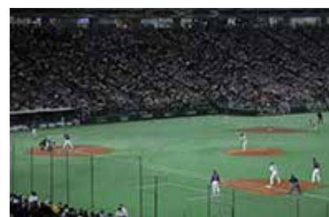
当日の様子 (2019年開催時)