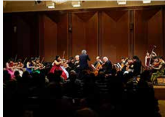
サントリーホール チェンバーミュージック・ガーデン2019

開館当初より音楽の情報発信基地としてオリジナル企画の主催公演を開催してきました。1987年から続く現代音楽の祭典“サマーフェスティバル”、開館25周年の2011年からスタートした初夏の室内楽の祭典“チェンバーミュージック・ガーデン”は国際的な注目を集めています。