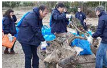
サントリー食品ヨーロッパ社の河川清掃