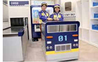
自動販売機に商品を届ける