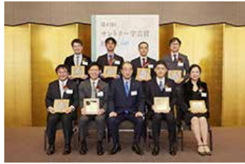
「サントリー学芸賞」贈呈式

文化財団は2019年で設立40周年を迎えました。40周年を機に、新たに『<知>をつなぐ、<知>をひらく、<知>をたのしむ』というコンセプトを掲げ、トークライブや、国際シンポジウム、地域文化をテーマにしたフォーラムなどの新しい取り組みを行ってきました。