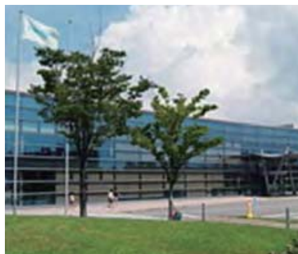
サントリープロダクツ(株)高砂工場

高砂工場として3R(Reduce、Reuse、Recycle)をさらに進めるとともに、地域と連携しながら森林整備活動に参画し、地下水の源流から自然を守り、「水と生きる」を実践していきます。